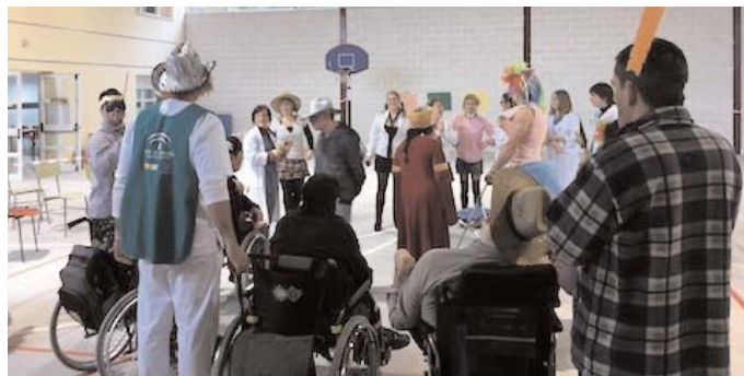
CONCURSO DE DISFRACES. La asociación ha celebrado su "propio" concurso de disfraces el pasado 4 de marzo. Los participantes han disfrutado de una divertida jornada.