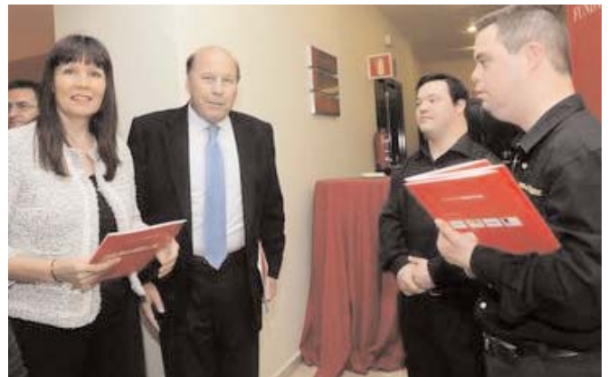
Este programa ya ha estado en funcionamiento en Murcia y Barcelona

Los candidatos procederán de las bolsas de trabajo de las entidades sociales que colaboran en el proyecto, por lo que ASPACE Andalucía y las asociaciones federadas se beneficiarán de ello. Así, los participantes recibirán la formación exigida por la empresa y según el puesto de trabajo al que opten. Además, tendrán