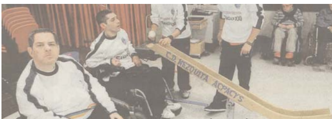
EXTRAIDO DE: DÍA DE CÓRDOBA 15/03/2011

El Club Deportivo Mezquita-Acpacys ha mostrado a los usuarios de la Residencia de Gravemente Afectados de la Federación Provincial de Minusválidos Físicos y Orgánicos de Córdoba una partida de este deporte para enseñarles los beneficios de su práctica deportiva.