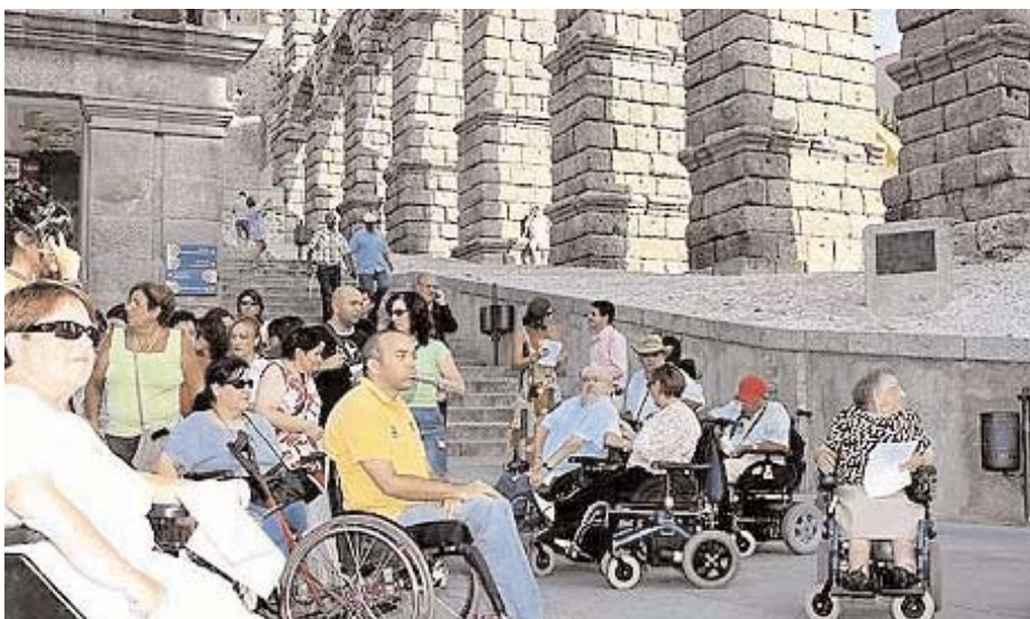
Una serie de normas regularán la accesibilidad de los productos y los entornos //www.viajeblog.es

Por ello, van a sensibilizar en este campo a los profesionales del sector turístico tanto público como privado. Entre las acciones previstas, la modificación del convenio contempla el desarrollo de seminarios, cursos y jornadas, la publicación de material didáctico y la promoción