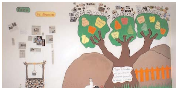
EL ÁRBOL DE LAS FUNCIONES. Con motivo de la inauguración del Taller de Empleo han creado este simbólico árbol con tres ramas: área psico-social, área educativa y área asistencial.