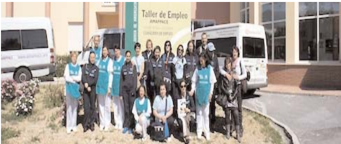
Los profesionales del TE "Mijas de la mano" durante la visita a Amappace