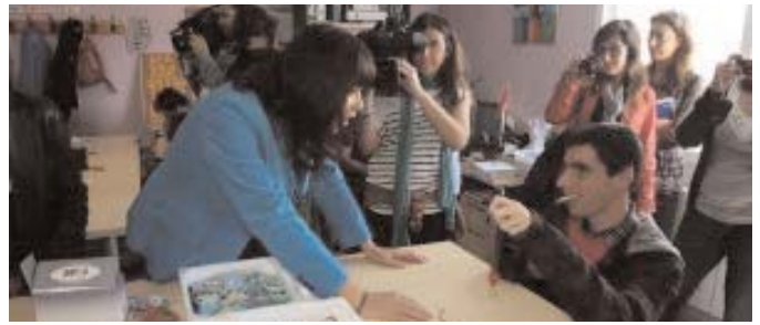
Las familias han aportado algunos artículos

Cuenta con ocho expositores en los que se muestran una gran variedad de productos que van desde bisutería, complementos, ropa de bebé y juguetes hasta libros, discos, cuadros y otras piezas decorativas. Los trabajadores de Aspace Jaén han recolectado estos artículos, todos nuevos, gracias a la donación de jienenses anónimos, y a la colaboración de los padres y madres aso-