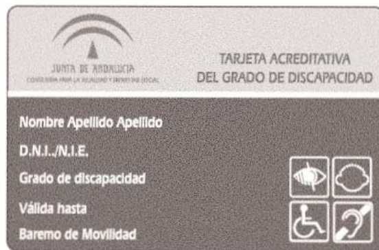
El nuevo formato incluye medidas que evitan su falsificación

La tarjeta tendrá un formato único para todos los tipos de discapacidad e