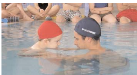
Las prácticas han sido en una piscina cubierta// UJ

Los alumnos han adquirido conocimientos sobre diferentes temáticas como la mecánica de fluidos, el trabajo individual, el trabajo uno-uno, la prevención de caídas y el riesgo de