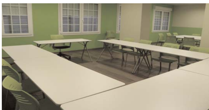
Las mesas y sillas son plegables para permitir el acceso en silla de ruedas

La Obra Social de Caja Madrid y la Consejería de Igualdad y Bienestar Social han financiado el proyecto. Personas con parálisis cerebral, voluntarios, profesionales y otras personas relacionadas con las entidades Aspace de Andalucía podrán recibir formación de calidad en esta zona accesible y destinada a la formación.