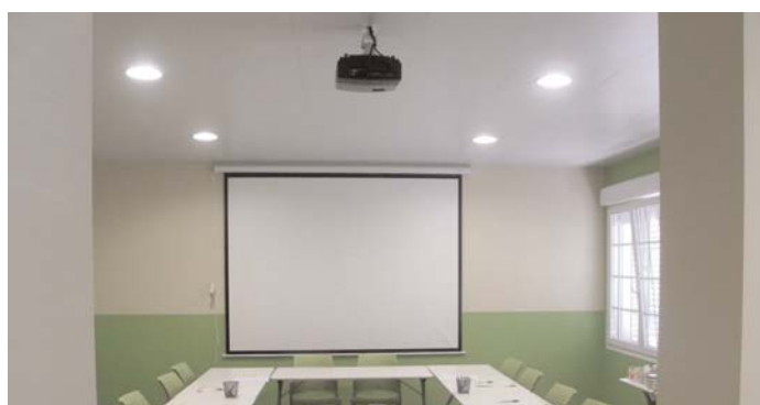
Los proyectores se utilizan para formación y para realizar videoconferencias

La equipación de la sala de formación de la Federación ha sido posible gracias a las subvenciones recibidas de la Consejería de Igualdad y Bienestar Social, así como de la Obra Social de Caja Madrid.