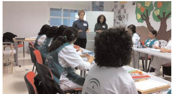
Los alumnos también deben aprender cómo buscar un trabajo

desarrolladas en el entorno de los menores también han sido una de las áreas que han aprendido el alumnado del TE de Amappace. Así, ya saben qué importancia tiene la coordinación con los colegios y la labor interdisciplinar que se lleva a cabo en la asociación.