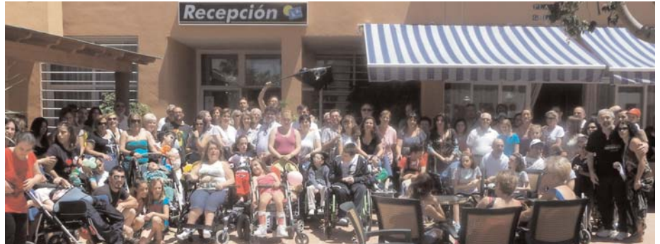
Las personas con parálisis cerebral y sus familiares han convivido durante tres días en Almuñécar

Las familias fueron llegando tímidamente al complejo hotelero Turismo Tropical. De hecho, la mayoría han asistido por primera vez, aunque otros son ya veteranos. El primer contacto entre familiares comenzó cerca de la piscina: unos y otros observaban una grúa de acceso que se levantaba al borde del pretil y explicaban cómo utilizaban una muy similar y de fabricación casera en el