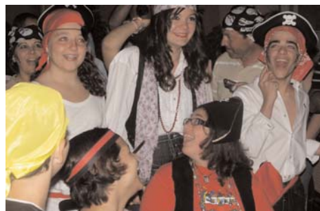
La búsqueda del tesoro pirata continuó por la noche