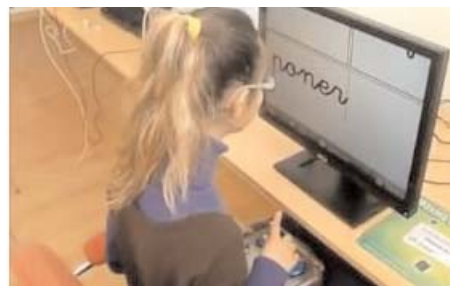
Fotograma: Crear para convivir