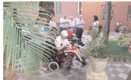
// Un grupo durante la visita al Palacio de la Najarra