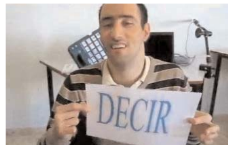
Fotograma: Acércate a conocernos

Estas tres asociaciones ligadas a Federación ASPACE Andalucía piden el voto para sus cortometrajes presentados al concurso Romper Barreras que organizan las empresas BJ Adaptaciones y Toshiba. SE puede votar al favorito hasta el 31 de agosto de 2011.