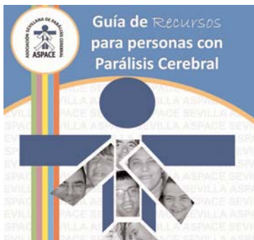
Fragmento de la portada de la guía de recursos

ASPACE Sevilla ha elaborado el manual titulado Guía de Recursos para personas con parálisis cerebral de Sevilla . Este documento aglutina información sobre legislación, dependencia, subvenciones y otros servicios a los que pueden acceder.