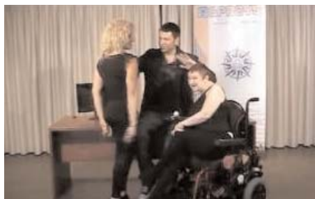
Fotograma: Acpacys Shopping

La asociaciones federadas Acpacys, Aspace Sevilla y Upace San Fernando han presentado sus cortometrajes Acpacys Shopping , Acércate a conocernos y Crear para convivir , respectivamente, en el concurso Romper Barreras organizado por BJ Adaptaciones y Toshisha. Las votaciones se pueden realizar hasta el 31 de agosto en la web de los Premios.